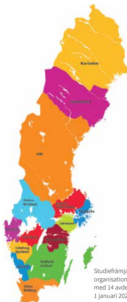
Studieförbundets organisationskarta med 14 avdelningar, 1 januari 2021.

Tillit och dialog är två begrepp som vi ofta använder i folkbildningen. De vägleder oss i mötet med deltagarna, och jag tror att de även kan vägleda oss när vi själva ser framåt, på vår egen utveckling som studieförbund. Att