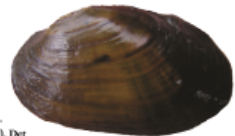
Tjockskalig målarmussla Unio crassus

Skalet hos äkta målarmussla är avlångt, 7–10 centimeter långt (hos stora spöformer ibland upp till 14 centimeter) och 3–4 centimeter högt. Det är oftast mer än dubbelt så långt som högt. Skalets över- och underkantar är nästan helt parallella. Underkanten höjer sig uppåt först långt ut i den utdragna, tillspetsade bakänden, vilket ger hela skallet ett "tungformat" utseende. Skalfärgen går ofta i en gul-gulbrun-ljusgrön färgskala. Skulpturen på umbo (skalbackan) består av sex knörliga upphöjningar, ordnade i två rader. Den främre slutmuskelns fäste är, i jämförelse med den spetsiga målarmusslans, beläget relativt nära skalkanten. Huvudtänderna är smala och skarpkantade. I den vänstra skalhalvan överlappar den bakre huvudtanden den främre. Den bakre huvudtanden är densamma oftast mindre och ibland reducerad till en liten, kantig upphöjning på insidan av den främre. Sidotänderna är höga, skarpkantade och mycket långa.