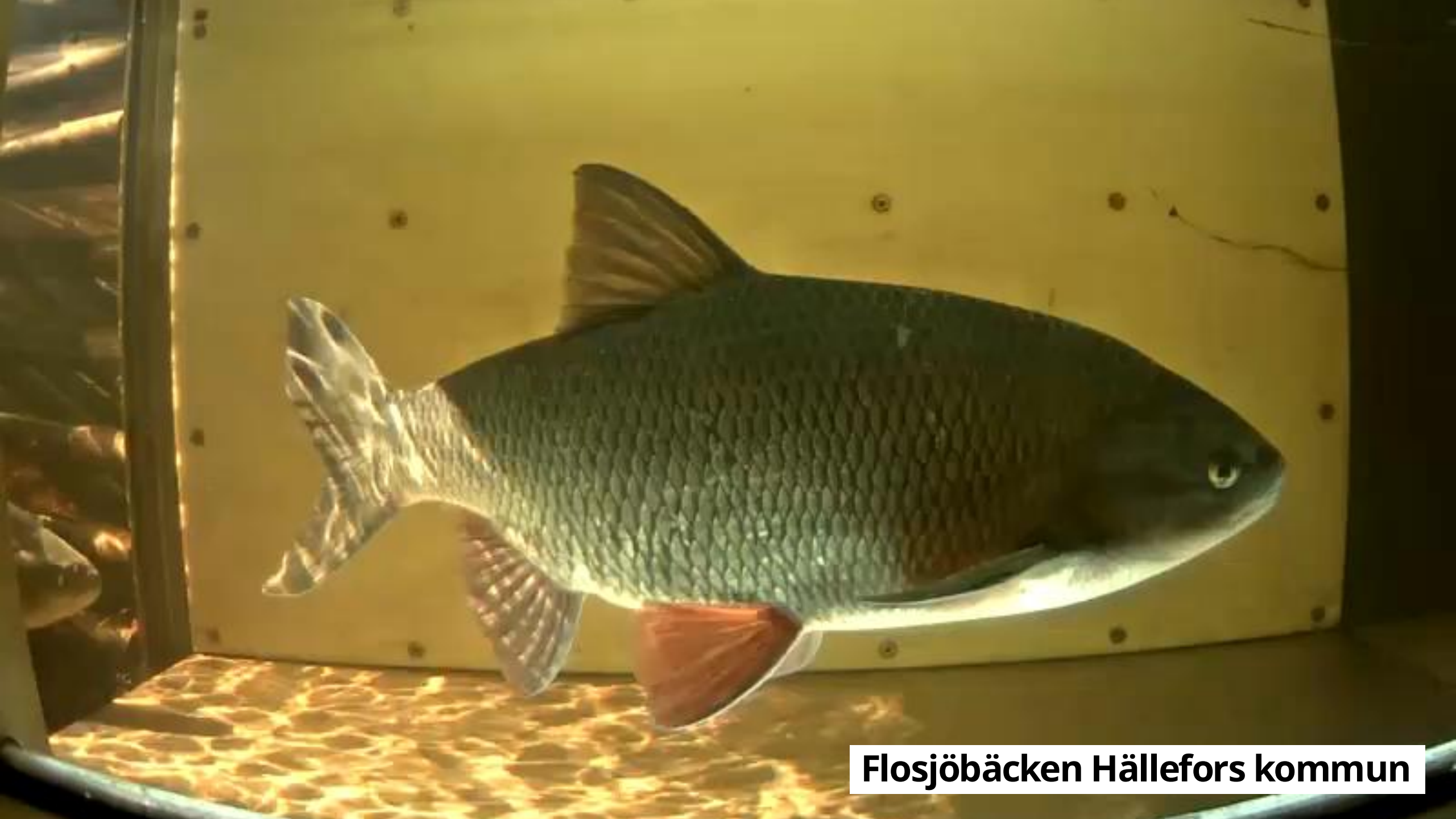
Flosjöbäcken Hällefors kommun