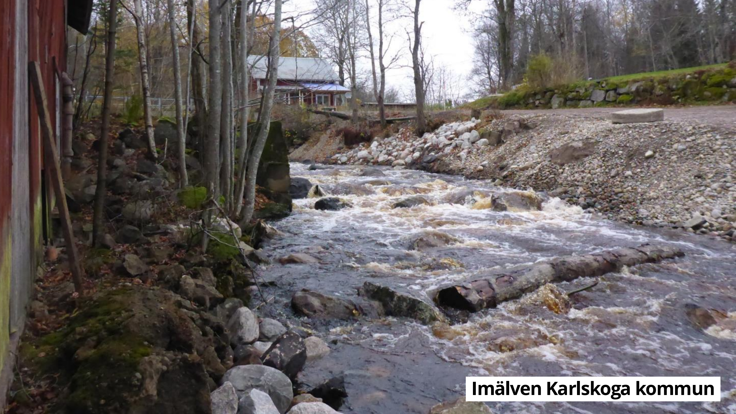
Imälven Karlskoga kommun