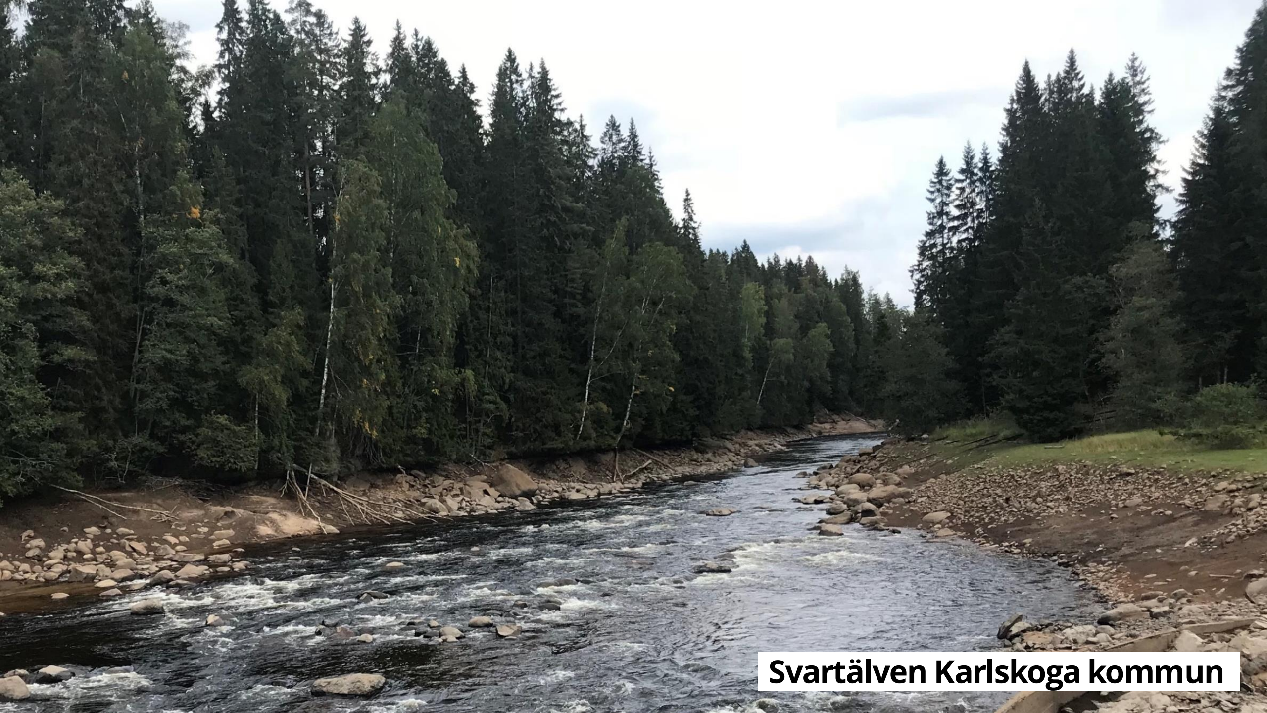
Svartälven Karlskoga kommun