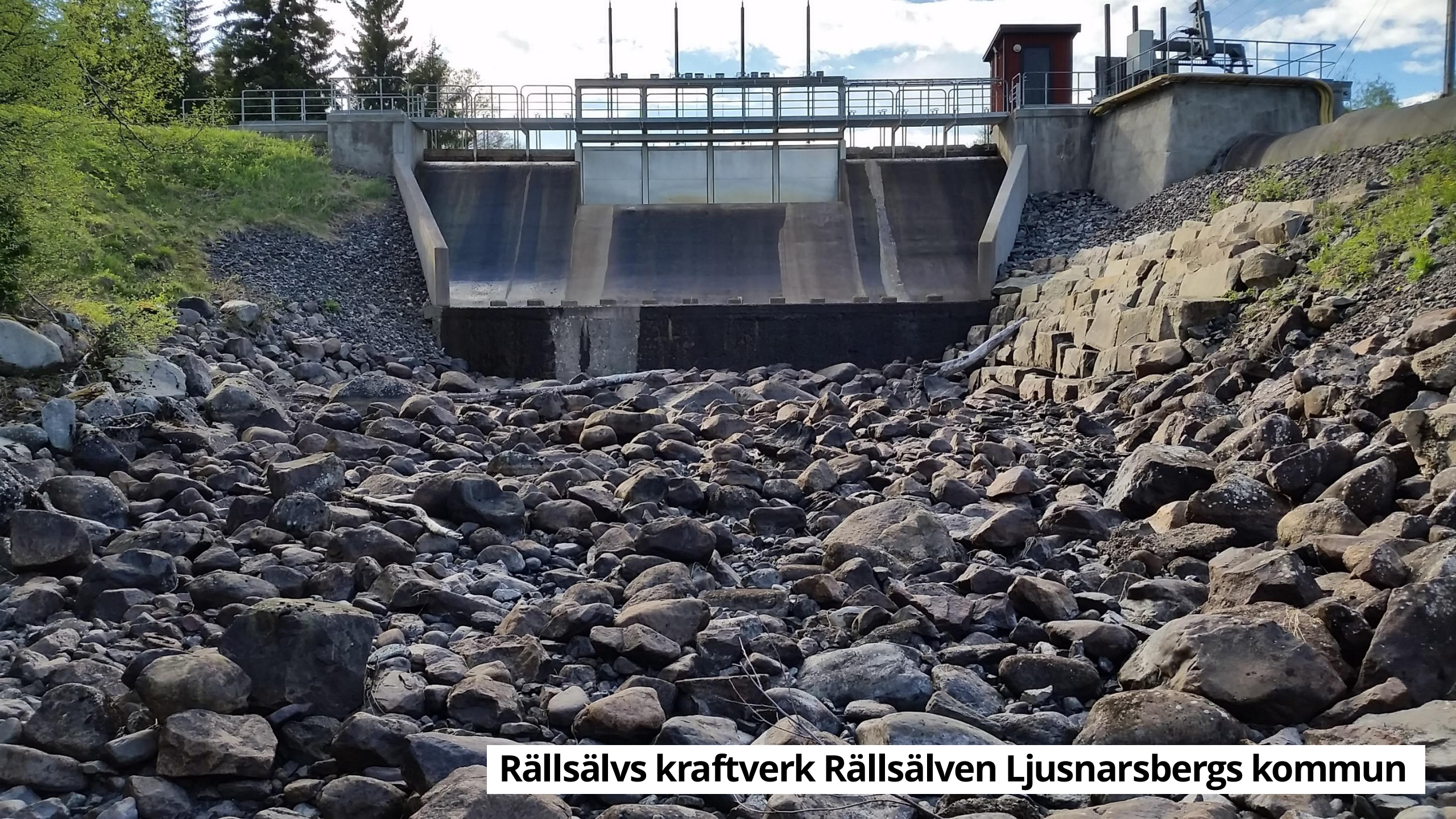
Rällsälvs kraftverk Rällsälven Ljusnarsbergs kommun