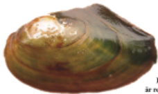
Allmän dammussla Anodonta anatina

Den allmänna dammusslans skal är rombiskt till äggformat och tämligen stort i omkrets. Det blir vanligtvis 7–10 centimeter långt (1 undantagsfall upp till 14 centimeter). Skalfärgen är oftast gul till gulgrön med livliga gröntoner. Skallets över- och underkant divergerar ofta bakåt. Överkanten övergår ofta svårt i bakkanten. Tjockleken hos skalhalvorna tilltar nedåt, speciellt i framänden. Detta känns tydligt om man håller skalet i framänden mellan tummen och pekfinger. Drar man sedan fingrarna nedåt mot den undre kanten så känner man att skallets tjocklek ökar. Skulpturen på umbo (skalbackan) består av 8–10 vågförmade åsar, vilka överkorsar skallets tillväxtlinjer. Inströmningsöfösen är bred med korta papiller. Mjukdelarnas färg går ofta i grön till grågul.