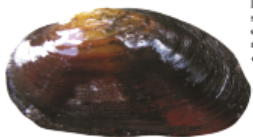
Större dammussla Anodonta cygnea

Den allmänna dammusslans skal är rombiskt till äggformat och tämligen stort i omkrets. Det blir vanligtvis 7–10 centimeter långt (1 undantagsfall upp till 14 centimeter). Skalfärgen är oftast gul till gulgrön med livliga gröntoner. Skallets över- och underkant divergerar ofta bakåt. Överkanten övergår ofta svårt i bakkanten. Tjockleken hos skalhalvorna tilltar nedåt, speciellt i framänden. Detta känns tydligt om man håller skalet i framänden mellan tummen och pekfinger. Drar man sedan fingrarna nedåt mot den undre kanten så känner man att skallets tjocklek ökar. Skulpturen på umbo (skalbackan) består av 8–10 vågförmade åsar, vilka överkorsar skallets tillväxtlinjer. Inströmningsöfösen är bred med korta papiller. Mjukdelarnas färg går ofta i grön till grågul.