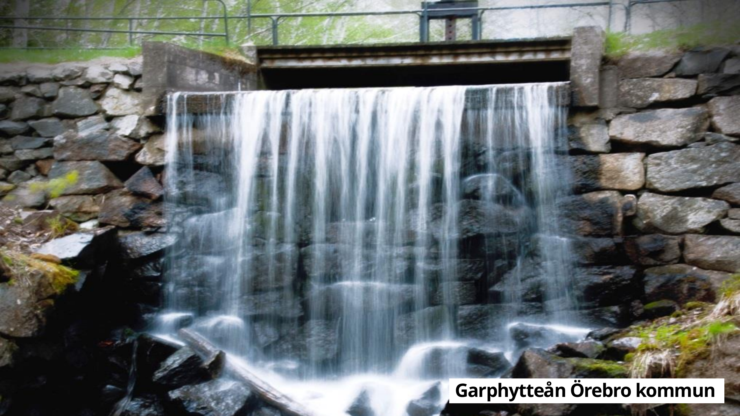
Garphytteån Örebro kommun