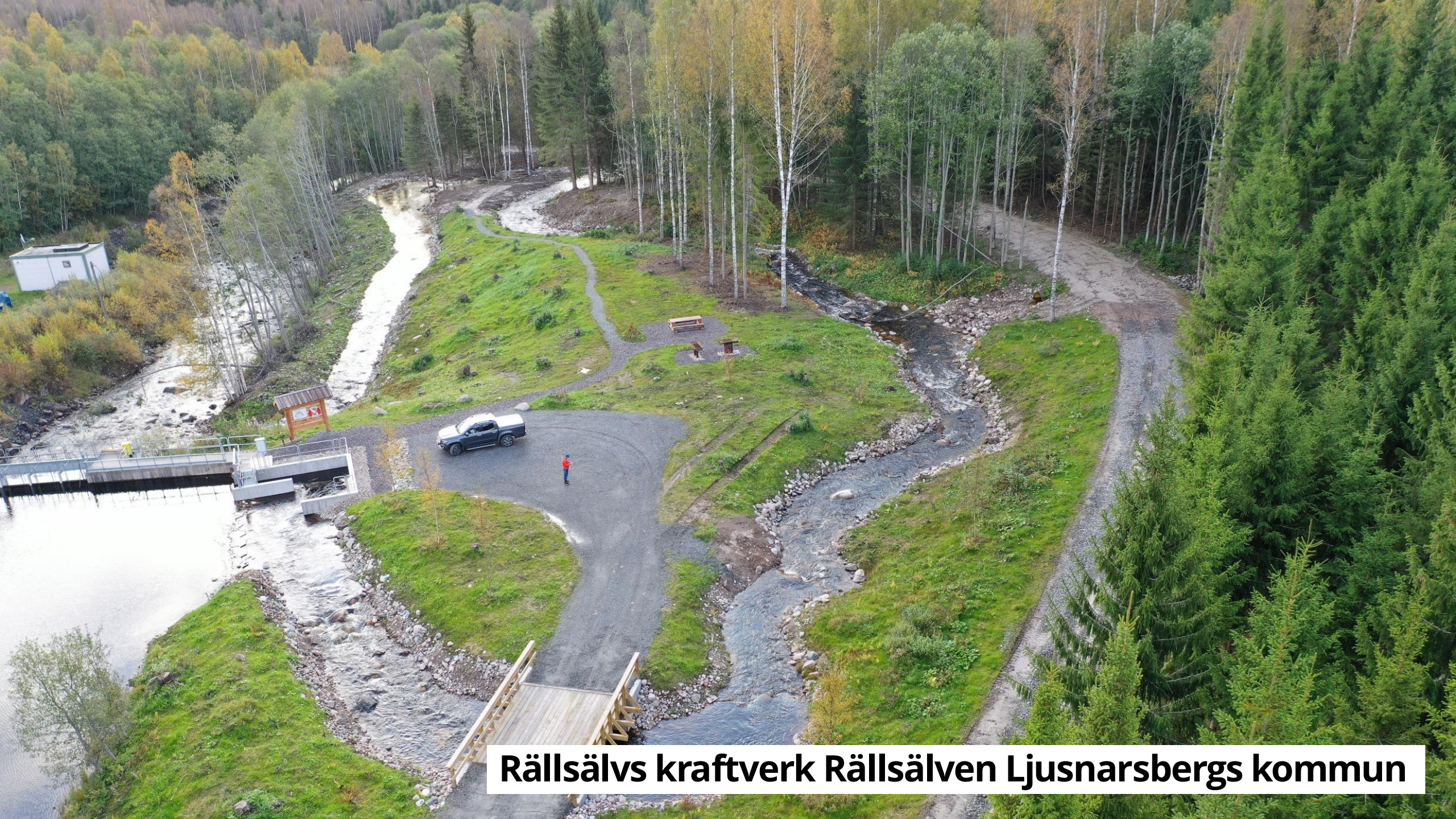
Rällsälvs kraftverk Rällsälven Ljusnarsbergs kommun