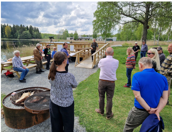
Invigning vid Grythyttvikens i maj 2023.