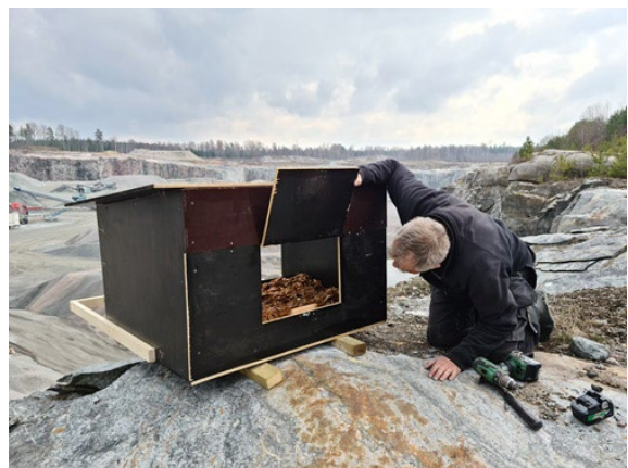
Montering av berguvsholk vid bergtäkt.