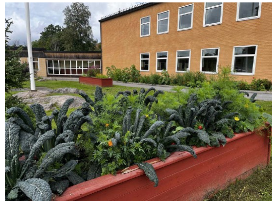
Naturguidning i Garphyttans nationalpark. Valfyllda odlingslådor på Kyrkbacksskolan.