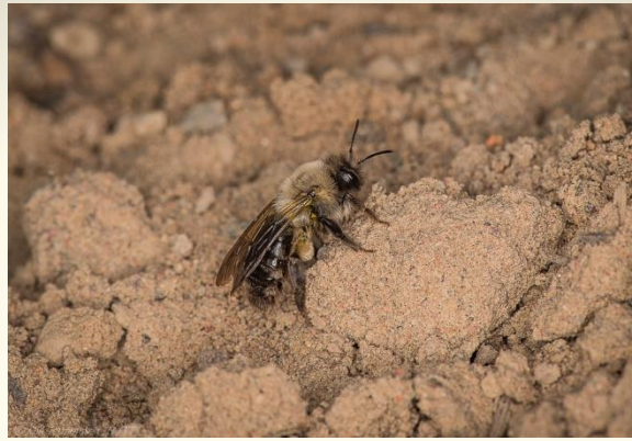
Grävbin (Andrenidae) 69 arter