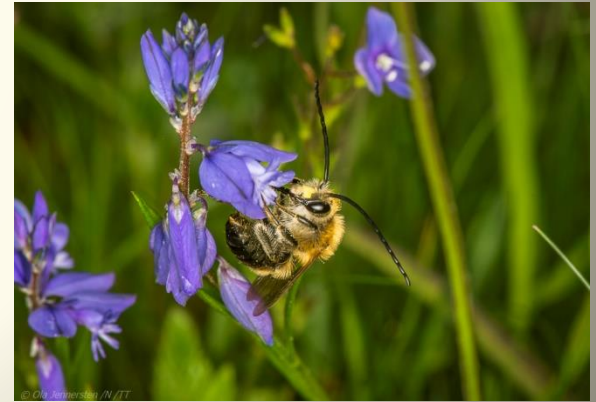
Långtungbin (Apidae) 110 arter