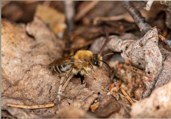
Korttungebin (Colletidae) 33 arter