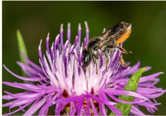
Buksamlarbin (Megachilidae) 60 arter