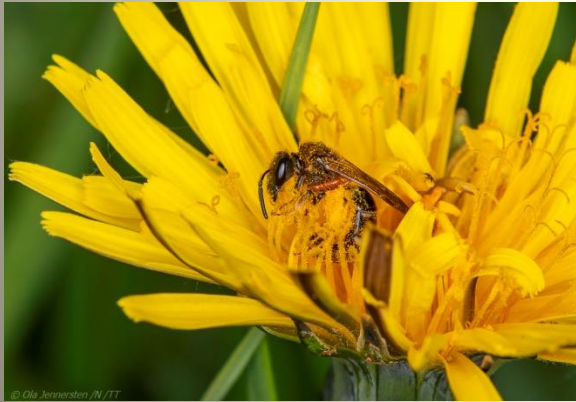
Vägbin (Halictidae) 62 arter