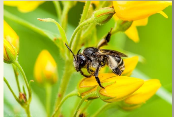
Sommarbin (Melittidae) 9 arter